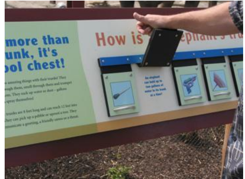
Ejemplo : Point Defiance Zoo & Aquarium Interactive Flip Pane