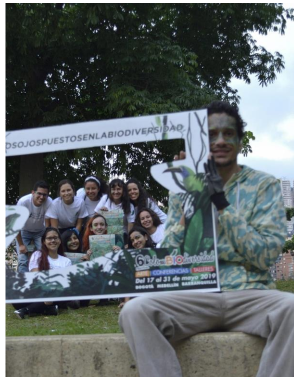
Street marketing ColombIOdiversidad 2019