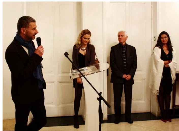
Inauguración de ColomBIOdiversidad 2016 en la Embajada de Francia, Bogotá

Animaciones (música, viaje sonoro, lecturas...) alrededor del tema de las aves